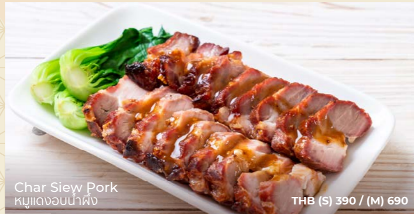
Char Siew Pork หมูแอดจอน้ำผึ้ง THB (S) 390 / (M) 690