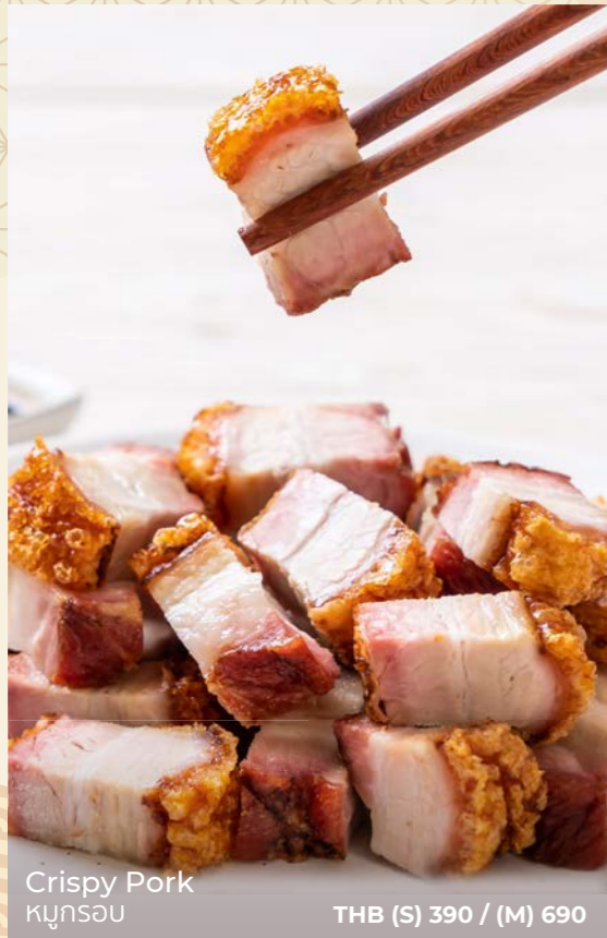
Crispy Pork หมูกรอบ THB (S) 390 / (M) 690